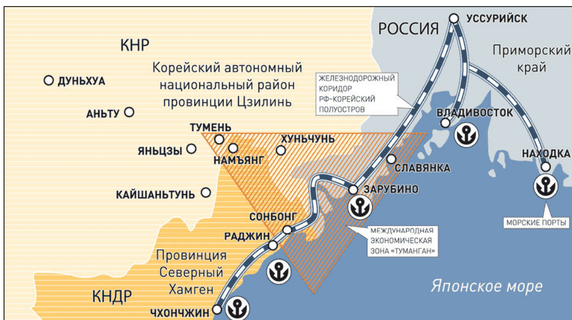
Рис. 2. Стыковка Транссиба с северокорейскими железными дорогами