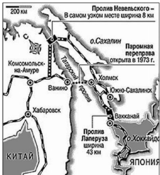
Рис. 1. План соединения Транссиба и железных дорог Японии (мыс Погиби – Сахалин – Хоккайдо)

Отсутствие мирного договора (как бы патовая ситуация) не мешает России и Японии активно развивать отношения и экономическое сотрудничество. 90 лет назад закончила своё политическое существование Дальневосточная республика, образованная правительством РСФСР для предупреждения столкновения коммунистической России и капиталистической агрессивной Японии. Более двух лет Тихоокеанская Россия успешно выполняла роль буфера между двумя сопредельными государствами. История (по Марксу) повторяется и сегодня эта территория (с точностью до наоборот) может сыграть роль стыковочного узла в процессе экономической кооперации с Японией и корейскими государствами. Япония, инвестируя в дальневосточные территории России, создавая здесь промышленные производства, как бы сохраняет лицо, развивая отношения не с далёкой Москвой, а с соседними территориями (Тихоокеанской Россией). Практическими «рычагами» интеграции двух экономик будут строительство моста мыс Погиби – о-в Сахалин, соо-