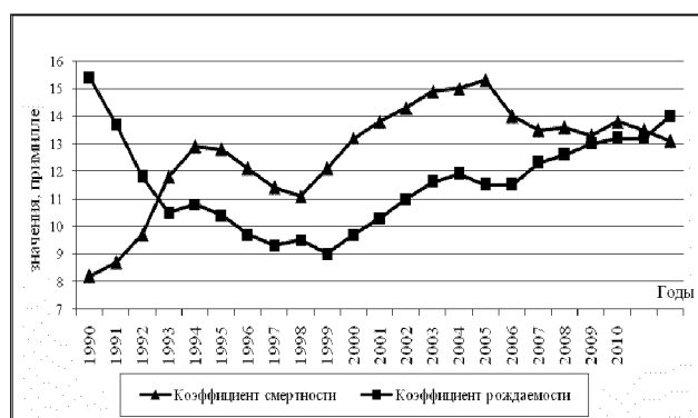
Рис. 2. Динамика коэффициентов рождаемости и смертности населения Дальнего Востока за период 1990–2012 гг., на 1000 нас. [4–6]

ло жителей Хабаровского края и Магаданской области вместе взятых. Темпы роста смертности в округе превосходят среднероссийские показатели: за 1990–2012 гг. в России смертность увеличилась на 18,7%, в ДФО – на 59,7% (табл. 2). Из всех регионов округа Магаданская, Амурская, Еврейская автономная области и Чукотский АО имеют самую неудовлетворительную медико-демографическую обстановку с низкой ожидаемой продолжительностью жизни (ОПЖ) и высокими показателями младенческой смертности, заболеваемости, смертности от туберкулеза. Для округа характерно возникновение с относительно благополучными регионами обширных депрессивных зон с низкими показателями здоровья населения и крайне высоким уровнем бедности [10].