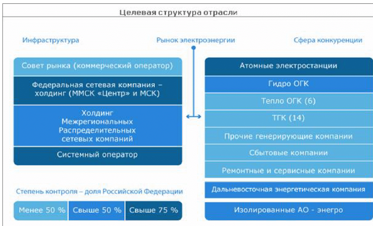
Рис. 1. Целевая структура электроэнергетики [4]

рали. Поэтому ТГК занимаются не только электро-, но и теплоснабжением.