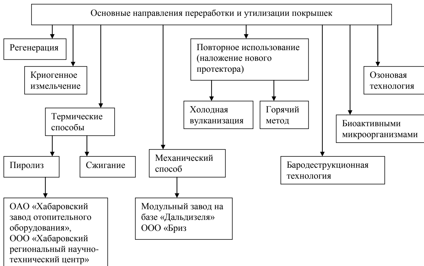
Рис. 1. Возможные варианты переработки и утилизации покрышек в Хабаровском крае

2. В зависимости от источников образования: производственные отходы сферы потребления – изделия, утратившие свои потребительские свойства в результате износа;